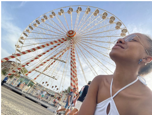
La grand roue Toulouse Plage