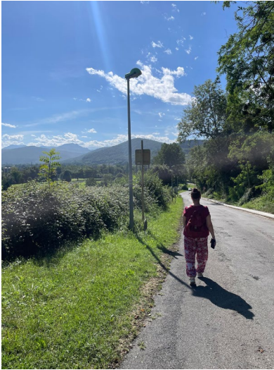
Meine super Führung

Wir haben uns so gut verstanden, dass wir in Kontakt bleiben möchten. Eine Freundschaft ist entstanden.