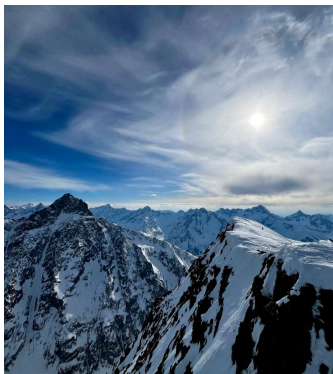
Skigebiet Le Deux Alps

Auch wenn Lyon offiziell eine ähnliche Einwohnerzahl wie Hannover hat, ist es als drittgrößte Stadt Frankreichs deutlich größer, da in Frankreich oft nahegelegene Orte nicht mit eingerechnet werden. Das Angebot an Events in Lyon ist riesig: Open-Air-Festivals, Second-Hand-Events, DJ-Sets in Museen, das Fête des Lumières oder der Barathon . Es lohnt sich, auf Instagram Seiten wie culturel_lyon zu folgen. Am Wochenende gibt es häufig Sportevents wie Rugby- und Fußballspiele, die preiswert und auf jeden Fall einen (oder mehrere) Besuche wert sind! Außerdem gibt es die Erasmus-Organisationen ESN, Erasmusparty und Erasmusplace, die regelmäßig Treffen, Feiern und Ausflüge organisieren.