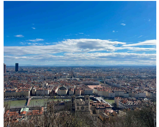
Blick von der Fourvière über Lyon

Was die Praktika angeht, muss man nicht für alle Zeiträume Praktika wählen, sondern kann dies nach eigenem Bedarf tun. Zum Auffrischen bzw. Erlernen der Sprache vor meinem Aufenthalt habe ich Sprach-Apps, tägliche Übungen und leicht verständliche Podcasts (z.B. Inner French ) genutzt. Außerdem gibt es vor Ort in Lyon einen Kurs bei einer sehr lieben Lehrerin, den ich empfehlen kann.