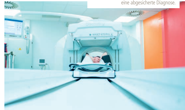
Am Anfang der Erkrankung steht immer eine abgesicherte Diagnose.