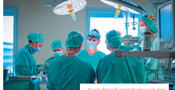
Neueste Behandlungsmethoden nach dem aktuellsten Stand der Wissenschaft.