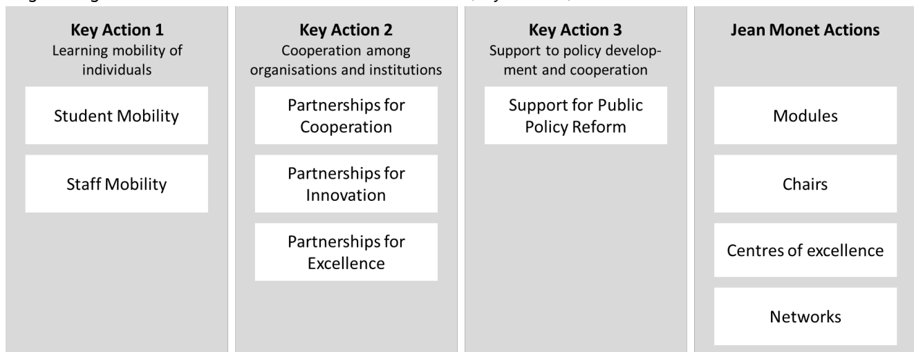
Abbildung 6: Grafische Darstellung der Programmstruktur von ERASMUS+. Mehr Informationen finden sich auf den Seiten der nationalen Agenturen zur Umsetzung des Programms. 14

Erasmus+ ist das EU-Programm zur Förderung von allgemeiner und beruflicher Bildung, Jugend und Sport in Europa. Es verfügt über einen Haushalt von ungefähr 26,2 Milliarden Euro und hat eine Laufzeit von 2021 - 2027. Das Programm gliedert sich in verschiedene Schlüsselaktionen ( Key Actions ):