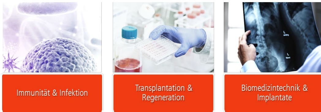
Abbildung 1: Schwerpunkte der MHH 7

Die MHH sieht die Lehre als eine zentrale Aufgabe Studierende und Mitarbeitende zu fördern. Sie hat einen erfolgreichen Modellstudiengang „Hannibal“ für die Humanmedizin etabliert, der gemäß dem Leibniz-Paradigma theoria cum praxi neue Maßstäbe im Wissenschafts- und Praxisbezug setzt. Neben dem Medizin- und Zahnmedizinstudium gibt es eine Reihe weiterer Studiengänge, wie beispielsweise Biochemie, Biomedizin, Biomedizinische Datenwissenschaften, Public Health, Hebammenwissenschaft, zum Teil in Zusammenarbeit mit der Leibniz Universität Hannover (LUH) und der Tierärztlichen Hochschule Hannover (TiHo). Mit dem internationalen ERASMUS-Studiengang „Infectious Disease and One Health“ ist auch ein erster Schritt Richtung Internationalisierung in der Lehre vollzogen. Darüber hinaus ist die MHH engagiert in der Ausbildung verschiedener Gesundheitsfachberufe.