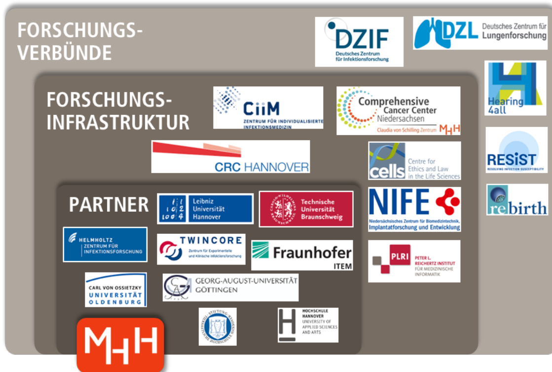
Abbildung 3: Grafische Darstellung der Forschungsverbünde, Forschungsinfrastrukturen und Partner der MHH

die Aktivitäten auf dem Gebiet der regenerativen Medizin. Diese Forschungszentren, sowie die Exzellenzcluster RESIST und Hearing4All, und die Mitgliedschaft der MHH in zwei deutschen Zentren der Gesundheitsforschung (Deutsches Zentrum für Infektionsforschung - DZIF, Deutsches Zentrum für Lungenforschung – DZL) haben die Chance, Teil einer im Aufbau befindlichen nationalen Roadmap der Infrastrukturen für die medizinische Forschung zu werden und stärken die Idee eines Hannover Health Science Campus (H2SC).