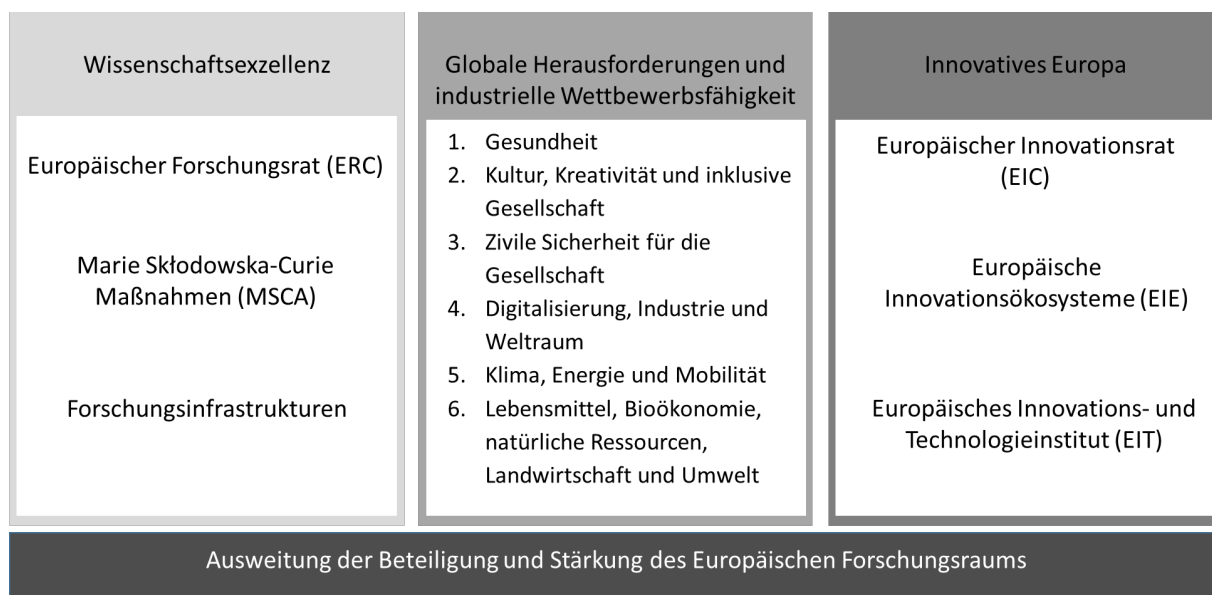
Abbildung 4: Grafische Darstellung der Programmstruktur von Horizon Europe. Mehr Informationen finden sich auf den Seiten des BMBF. 12

Das aktuelle Rahmenprogramm der EU für Forschung und Innovation, Horizon Europe, läuft von 2021 bis 2027 und verfügt über ein Budget von rund 95,5 Milliarden Euro. Es gliedert sich in drei Säulen, sowie einen horizontalen Bereich (siehe Abbildung 4). Das Vorgängerprogramm Horizon 2020 hatte ebenfalls eine Laufzeit von sieben Jahren und einen ähnlichen Aufbau 11 . Umgesetzt wird Horizon Europe durch ein- bis zweijährige Arbeitsprogramme, die für die einzelnen Bereiche separat veröffentlicht werden.