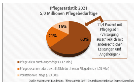
Grafik 1: Pflegestatistik 2021

Das Thema „Familienfreundlichkeit in Unternehmen, Behörden und Hochschulen“ bezog sich zunächst vor allem auf die Vereinbarkeit von Elternschaft und Erwerbsarbeit. Seit einiger Zeit rückt jedoch für Berufstätige und Studierende zusätzlich die Frage nach der Vereinbarkeit von Pflege naher Angehöriger bei gleichzeitiger eigener Berufstätigkeit in den Fokus. Als Folge des demografischen Wandels wird diese Aufgabe zunehmend aktueller.