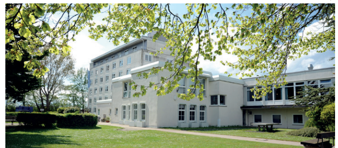
Die Pegasus Klinik in Großenbrode

Weiterführende Informationen: www.pegasus-klinik.de