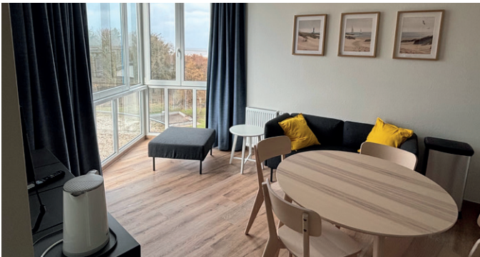
Neu saniertes und ausgestattetes Appartement

Nach diesen umfassenden Sanierungsmaßnahmen und Neuausstattungen wurde die Klinik am 18.02.2026 zur ersten Kur des Jahres wieder eröffnet. Die durchgeführten Maßnahmen katapultieren die Klinik in ein neues Zeitalter im modernen nordischen Einrichtungsstil . Dabei wurden diverse Bedürfnisse unserer Gäste wie z. B. breitere Betten für sich und ihre Kinder erfüllt und zugleich gesundheitsschonendere Arbeitsbedingungen für unsere Mitarbeiterinnen in unserem Reinigungsteam geschaffen.