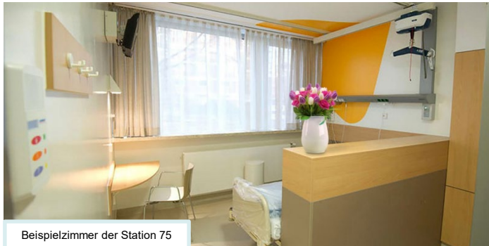
Beispielzimmer der Station 75