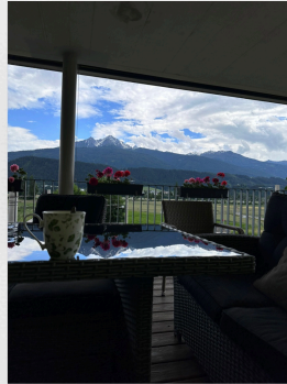
Aussicht vom Sationsbalkon

Alle Bilder wurden mit Einverständnis zur Nutzung im Rahmen des Erlebnisberichtes aufgenommen!