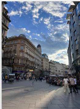
Tagesausflug nach Wien