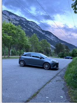
Unterwegs in Scharnitz