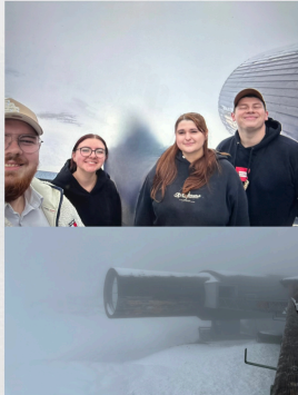
Ausflug zur Karwendelbahn