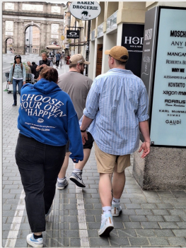
Erster Tag in Innsbruck