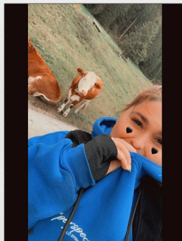
Ausflug nach Hintertux