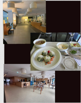
Innen Einrichtung und Mittagessen im Heim