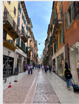
Tagesausflug nach Verona