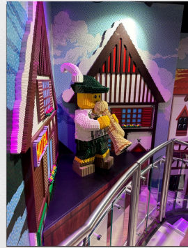
Ausflug nach München