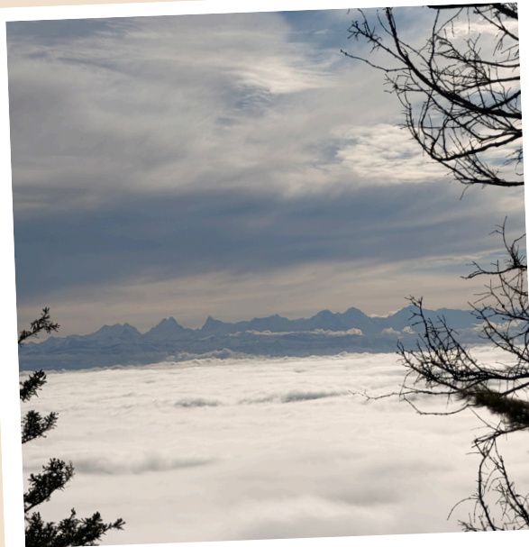
Wanderung in der Freizeit

Trotzdem hat mir der Einsatz geholfen, meine beruflichen Interessen klarer einzuordnen und herauszufinden, welcher Bereich der Pflege besser zu mir passt.