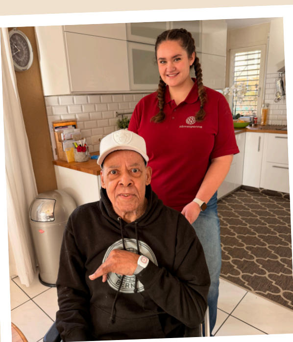
KLIENT MIT APOPLEX IN DER MORGENDLICHEN VERSORGUNG

Durch diese vielfältigen Aufgaben konnte ich wertvolle praktische Erfahrungen sammeln, meine pflegerischen Fähigkeiten erweitern und einen guten Einblick in den Arbeitsalltag in der ambulanten Pflege in der Schweiz erhalten.