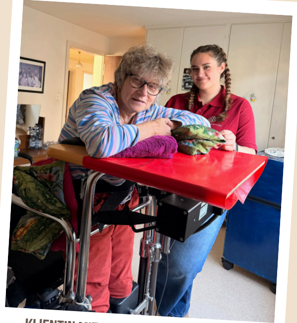
KLIENTIN MIT MULTIPLER SKLEROSE BEIM STEHTRAINING

In der Schweiz existieren verschiedene Ausbildungswege in der Pflege. Auf Tertiärstufe können Pflegefachpersonen ein Diplom als Pflegefachfrau bzw. Pflegefachmann HF an einer Höheren Fachschule oder einen Bachelor of Science an einer Fachhochschule erwerben. Auf Sekundarstufe II gibt es die dreijährige Berufslehre zur Fachfrau beziehungsweise zum Fachmann Gesundheit EFZ sowie die zweijährige Ausbildung zum Assistenten Gesundheit und Soziales EBA. Während meines Einsatzes wurde deutlich, dass die Aufgabenverteilung zwischen Fach- und Assistenzpersonal klar geregelt ist. Pflegefachkräfte tragen dabei häufig eine hohe Eigenverantwortung und verfügen über einen vergleichsweise großen Entscheidungsspielraum im Pflegealltag.