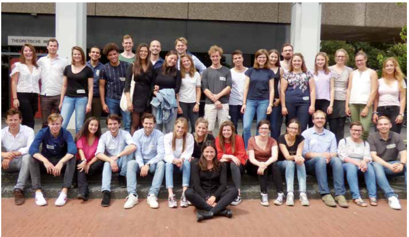
Voneinander lernen: die deutschen und holländischen Studierenden der Eurotransplant-Verbindungsbüros.

Die Medizinstudierenden des Eurotransplant-Verbindungsbüros